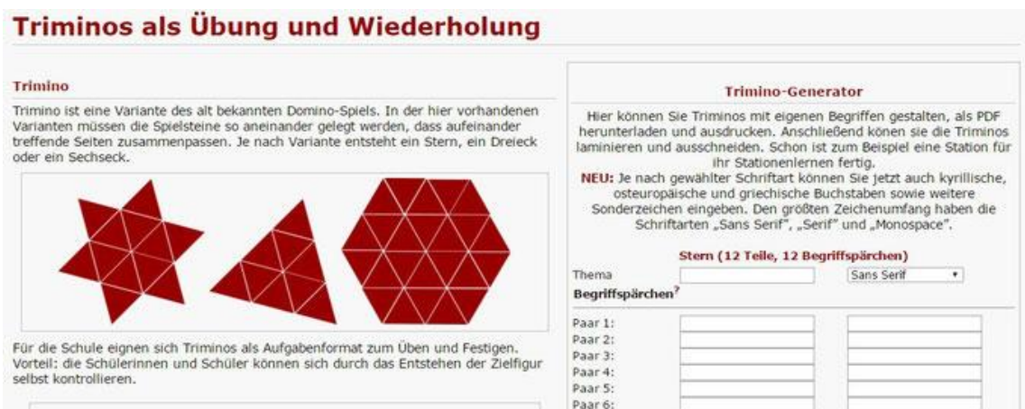
Abbildung 1: Triminos erstellen

Auf der Seite http://paul-matthies.de/Schule/Trimino.php können relativ einfach